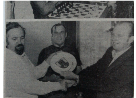
Höchstadt (ad). Am Wochenende stellte sich der für das Bundesligateam des SC Bamberg spielende Spitzenspieler Paul Radic im Rahmen der „Höchstadter Schachtag“ einem Simultanturnier beim Schachclub Höchststadt. Rund 20 Schachspieler waren gekommen, um gegen den Meister zu spielen. Bild unten zeigt einmal Paul Radic (links) und den Vorsitzenden des SC Höchststadt, Hermann Bauer (rechts), bei der Übergabe des Höchstadter Wappentellers und Bild oben) Radic in Aktion (ein ausführlicher Bericht mit Ergebnissen folgt)